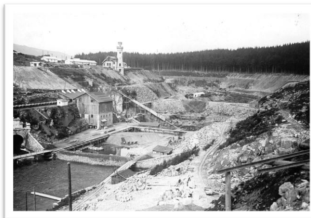
Staveniště stavby – r. 1912