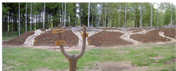
Model Krkonoš v osadě Hájemství

Naučná stezka byla vytvořena v rámci projektu LČR – PROGRAM 2000. Zhotovitelem stezky jsou Lesy České republiky s. p. Lesní správa Dvůr Králové n/L.