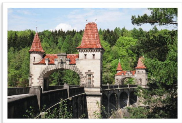
Přehrada Les Království

Nádherná vodní stavba, Těšnovská přehrada, známá spíše pod názvem Les Království, bezesporu patří mezi dominanty Podkrkonoší. Pokud ji navštívíte, budete si připadat jako v pohádce.